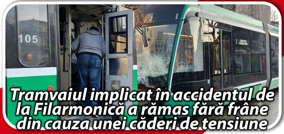
Tramvaiul implicat în accidentul de la Filarmonică a rămas fără frâne din cauza unei căderi de tensiune