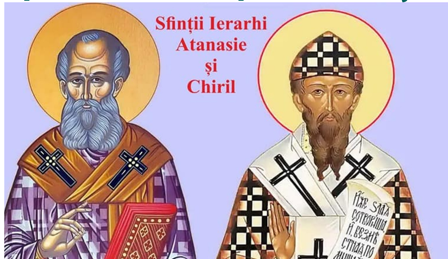
Sfinții Ierarhi Atanasie și Chiril

Sâmbătă, 18 ianuarie 2025, creștinii ortodocși îi sărbătoresc pe Sfinții Ierarhi Atanasie și Chiril, arhiepiscopii Alexandriei. Sărbătoarea este marcată în calendarul creștin ortodox cu o cruce neagră.