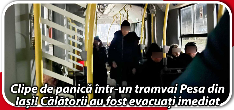
Clipe de panică într-un tramvai Pesa din Iași! Călătorii au fost evacuați imediat