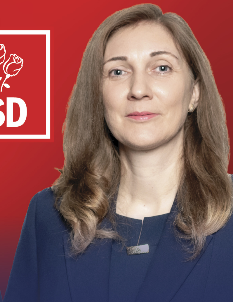
ROXANA NECULA SENATOR