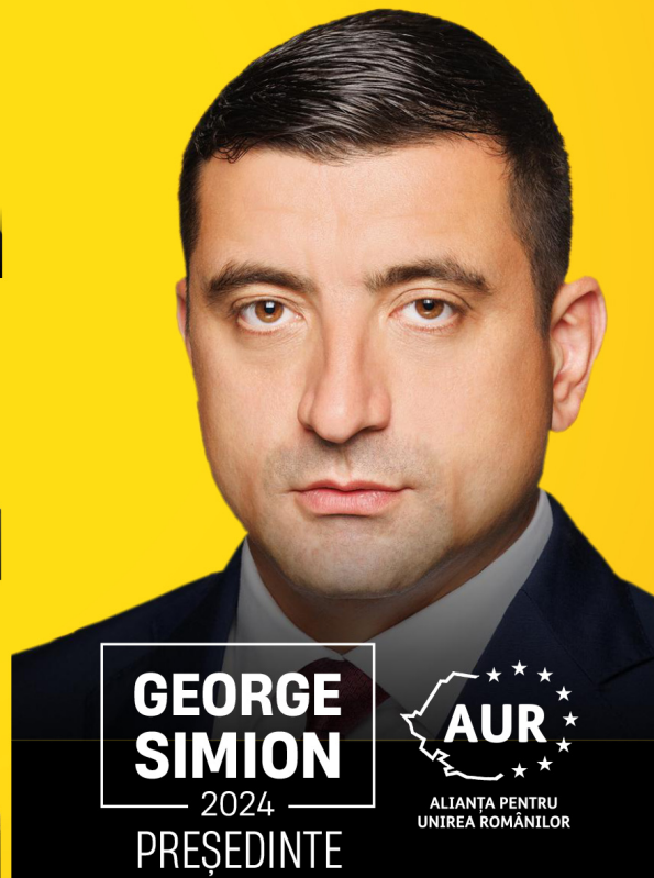
GEORGE SIMION — 2024 — PREȘEDINTE