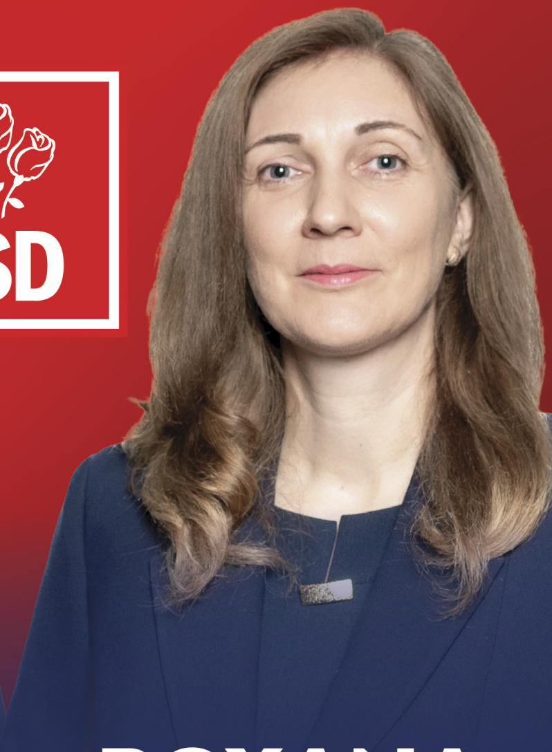
ROXANA NECULA SENATOR