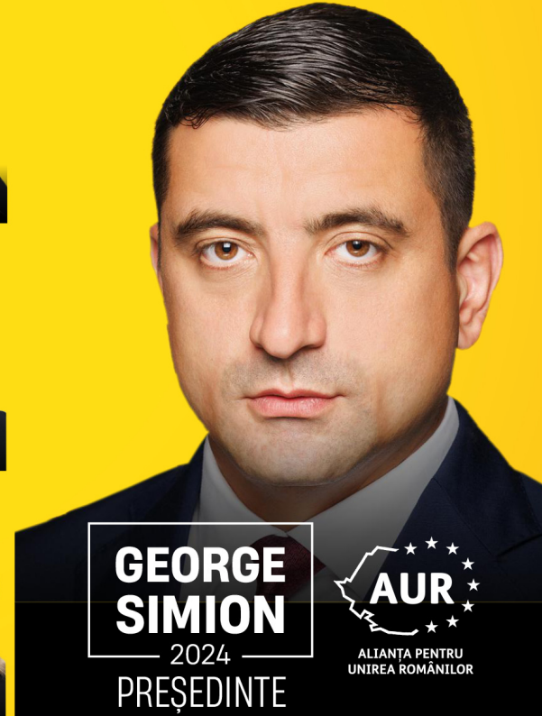
GEORGE SIMION — 2024 — PREȘEDINTE