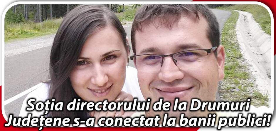
Soția directorului de la Drumuri Județene s-a conectat la banii publicii!