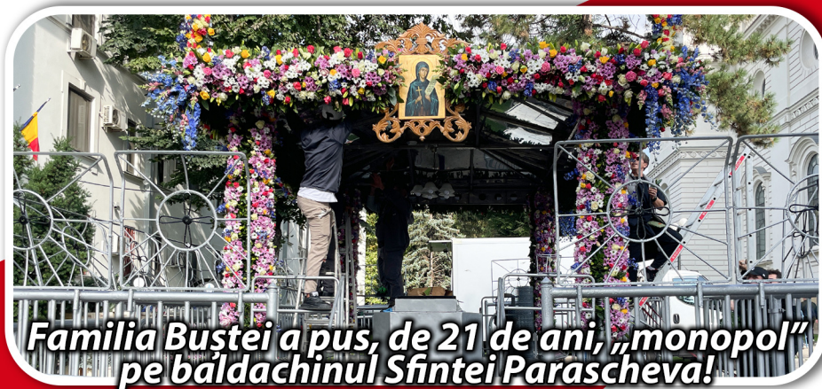
Familia Bustei a pus, de 21 de ani, „monopol” pe baldachinul Sfintei Parascheva!