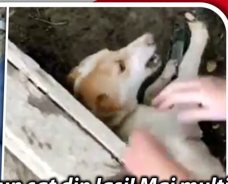
Imagini de groază într-un sat din Iași! Mai mulți câini erau chinuiți pe terenul unui localnic