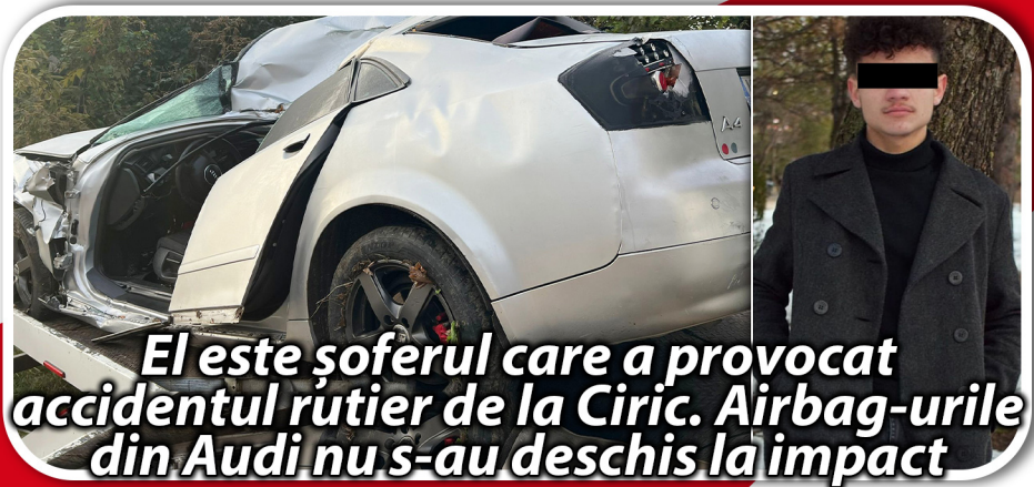
El este șoferul care a provocat accidentul rutier de la Ciric. Airbag-urile din Audi nu s-au deschis la impact