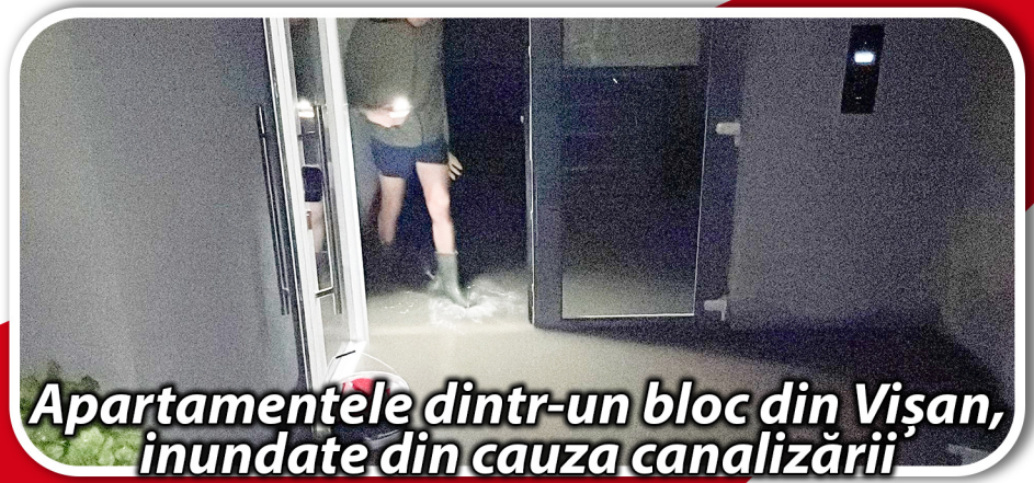
Apartamentele dintr-un bloc din Vișan, inundate din cauza canalizării