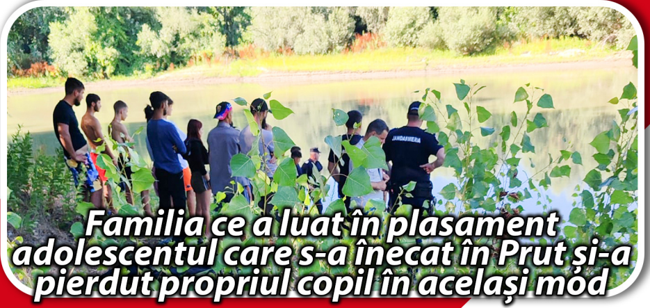
Familia ce a luat în plasament adolescentul care s-a înecat în Prut și-a pierdut propriul copil în același mod