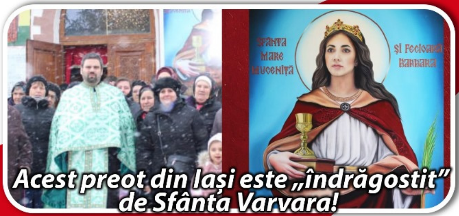
Acest preot din Iași este „îndrăgostit” de Sfânta Varvara!