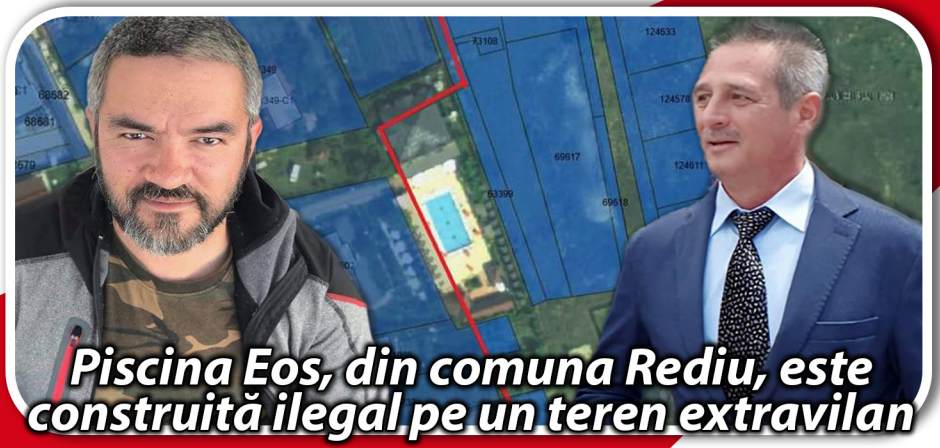
Piscina Eos, din comuna Rediu, este construită ilegal pe un teren extravilan