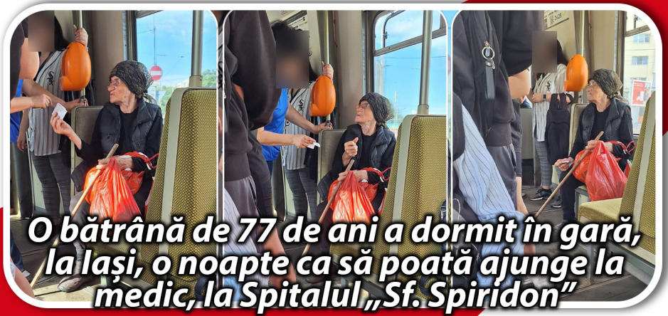
O bătrână de 77 de ani a dormit în gară, la Iași, o noapte ca să poată ajunge la medic, la Spitalul „Sf. Spiridon”